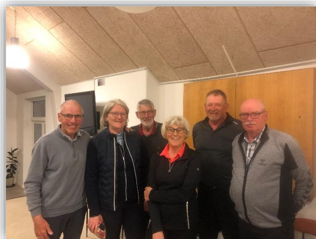
D-rækken på udebane i Dronninglund

Klubber i klubben er for hygge, socialt samvær og masser af golf. Du kan læse mere om de enkelte klubber på vores hjemmeside HER .