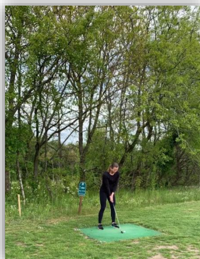
Først golfevent d. 22. maj