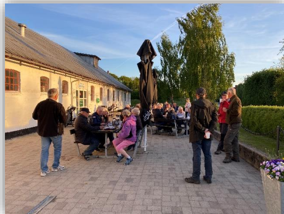
Banevandring d. 23. maj